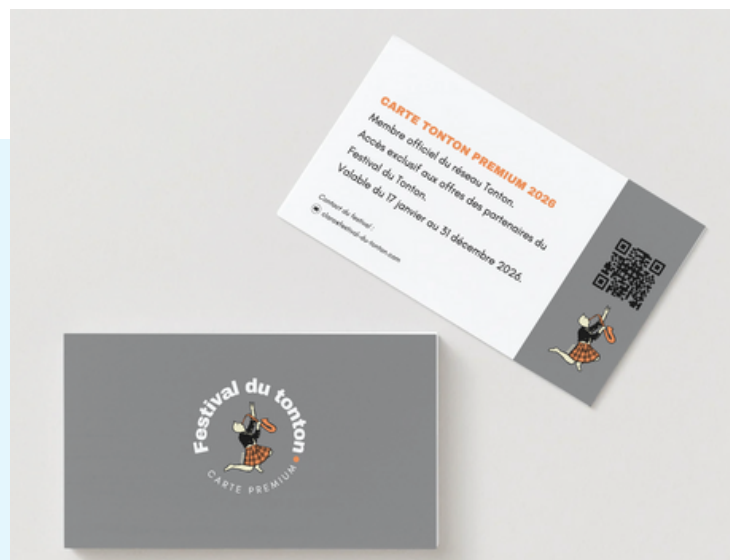
Non conforme à la réalité - à titre d'exemple.

Une belle occasion de valoriser votre entreprise et de renforcer le lien entre tous les acteurs du réseau Tonton.